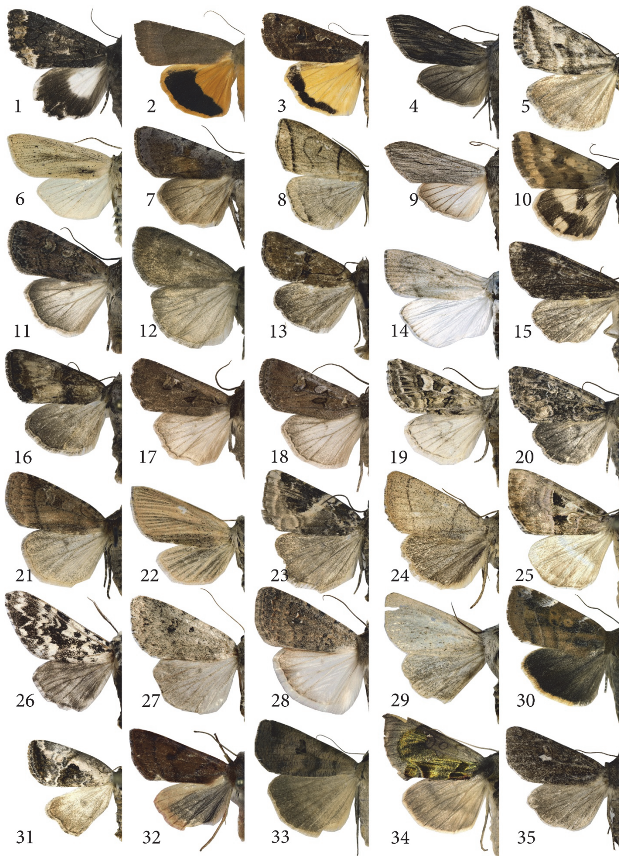
2. Виды совок, впервые указываемые из Нижегородской области. Пояснения на с. 49. К статье на с. 20 – 49.